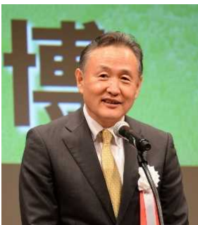
衆議院議員 二階議員より来賓挨拶 (ビデオレター)