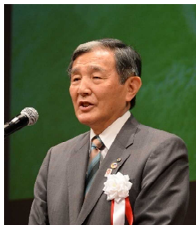
田辺市 真砂市長より歓迎挨拶