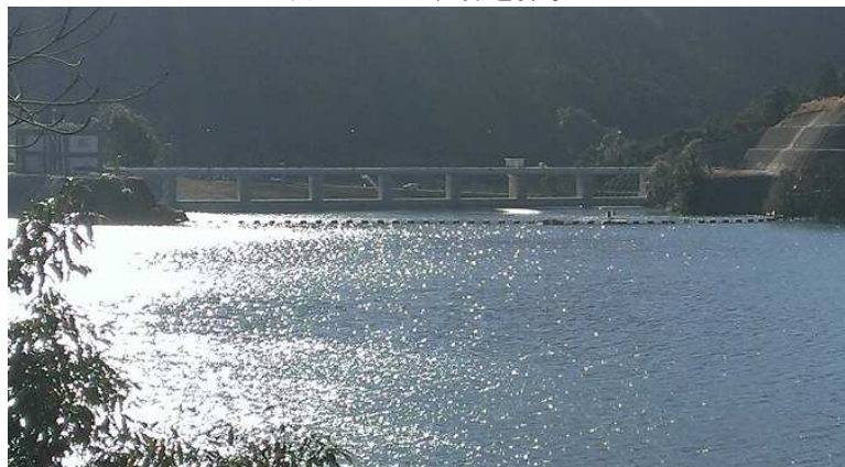
上流からダム堤体を撮影