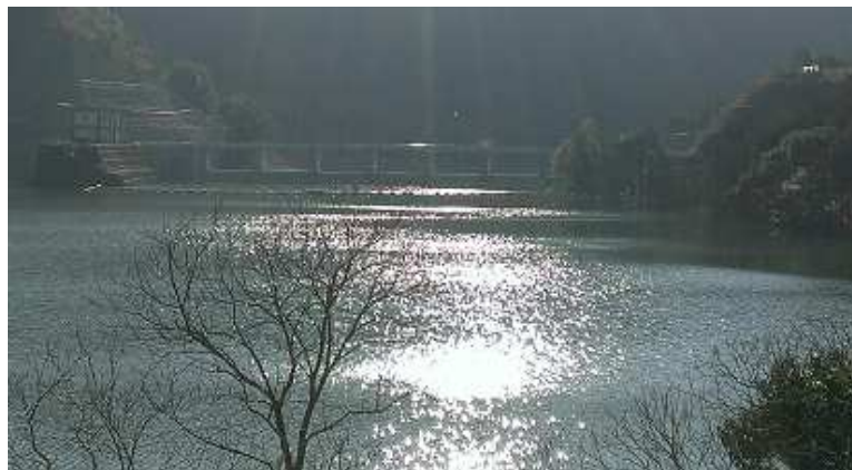
上流からダム堤体を撮影