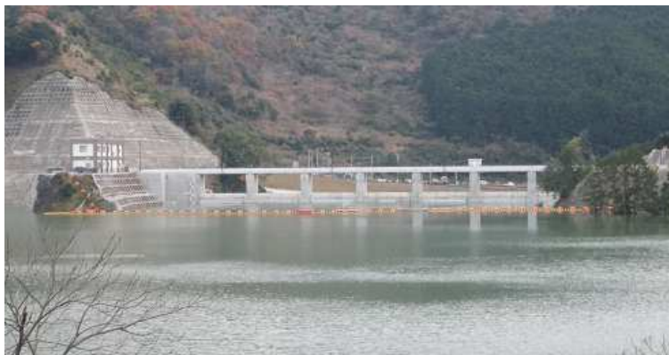
上流からダム堤体を撮影