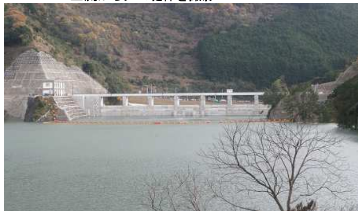
上流からダム堤体を撮影