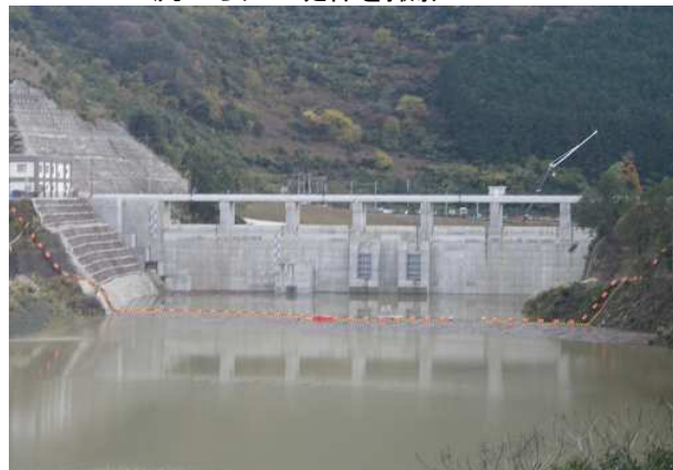
上流からダム堤体を撮影