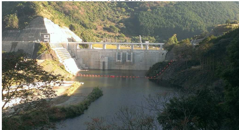
上流からダム堤体を撮影