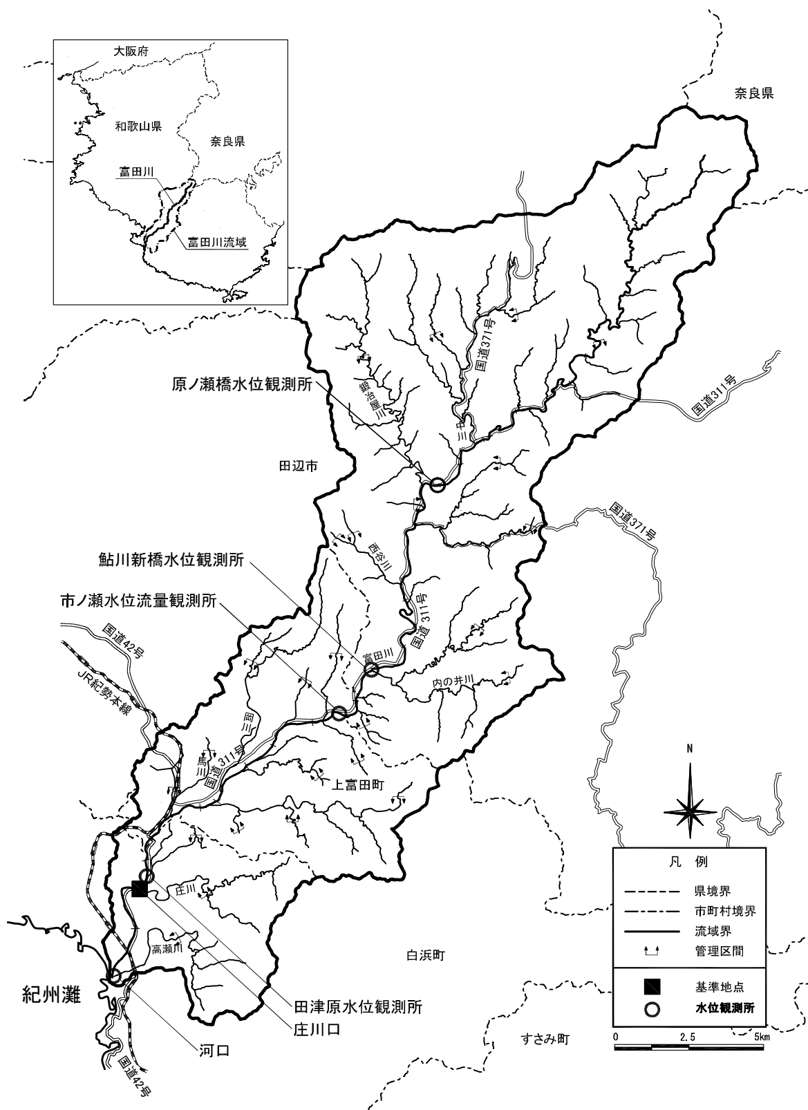
(参考図) 富田川水系図