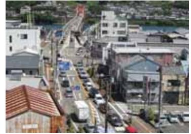
国道42号 新熊野大橋