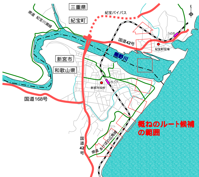
熊野川を渡る新たな道路の概ねのルート候補の範囲図(案)

(2) 熊野川を渡る新たな道路のルートについて、上記以外にご意見がありましたら、ご自由にお書き下さい。