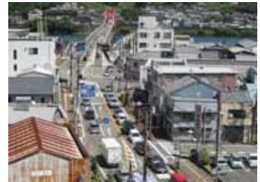
国道42号 新熊野大橋