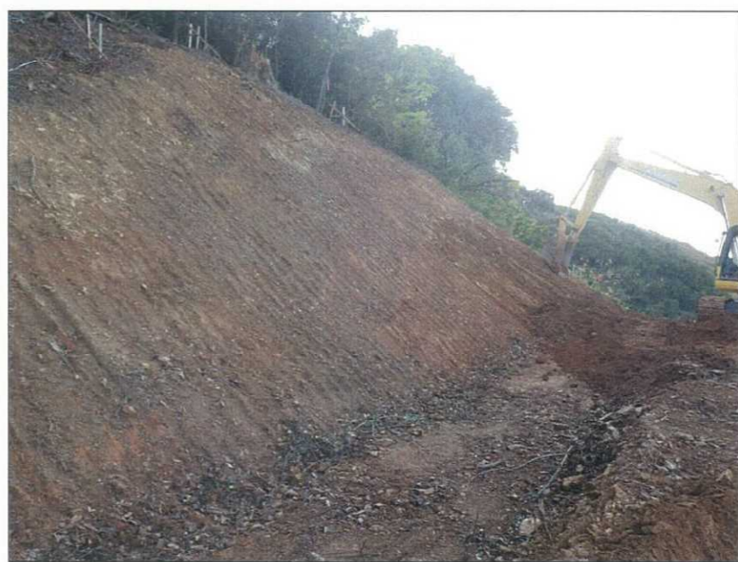
写真区分: 施工状況写真 工種: 土工 種別: 掘削工 写真タイトル: 切土整形状況