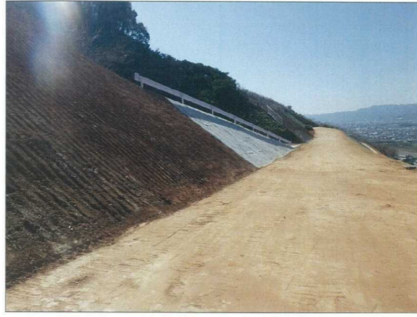
写真区分: 着手前及び完成写真 工種: 着工前・完成 種別: 完成 写真タイトル: 完成