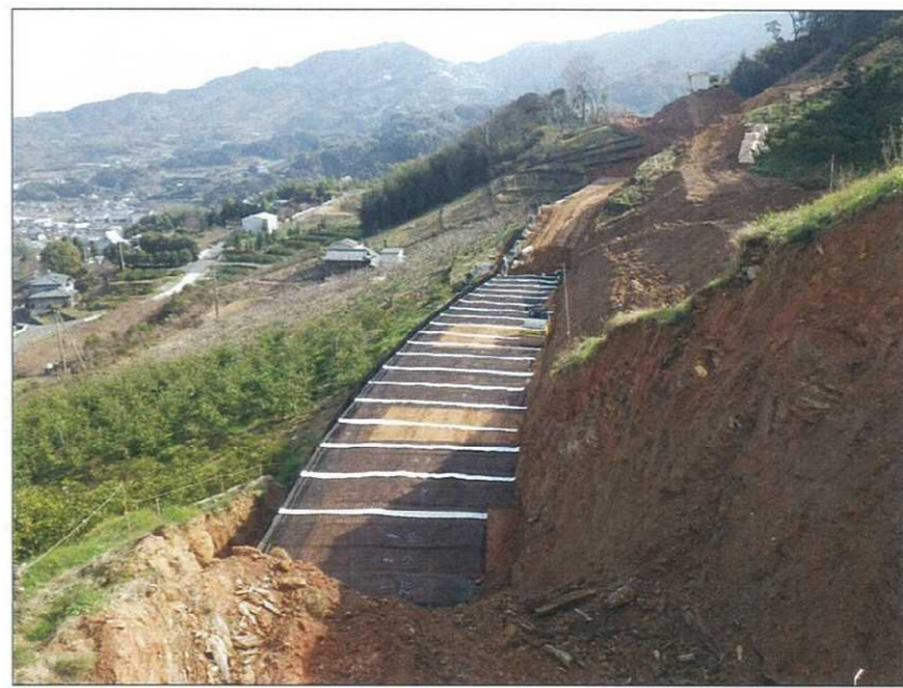
写真区分: 施工状況写真 工種: 補強土壁工 種別: ジオテキスタイル工 撮影箇所: 8段目 写真タイトル: 排水マット敷設完了