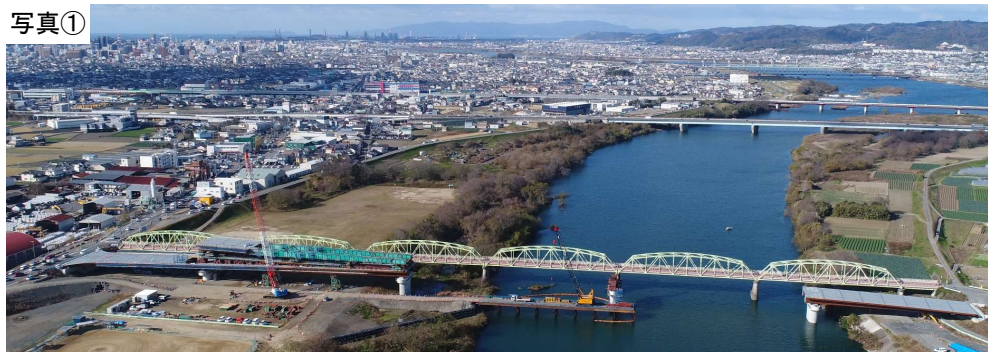
令和4年12月31日現在(施工状況)