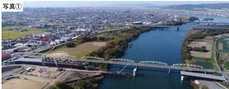
令和4年11月30日現在(施工状況)