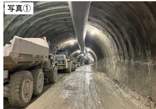
令和6年6月末現在(施工状況)