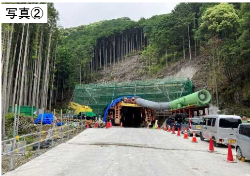
令和6年5月末現在(施工状況)