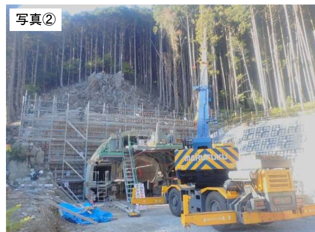
令和4年12月31日現在(施工状況)