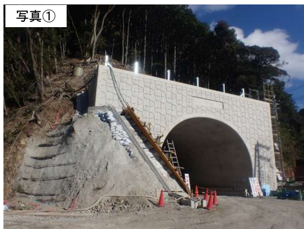
令和4年12月31日現在(施工状況)