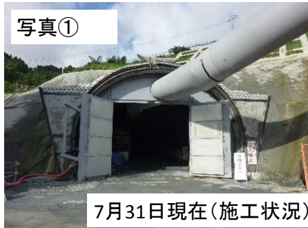
トンネル工事 の状況