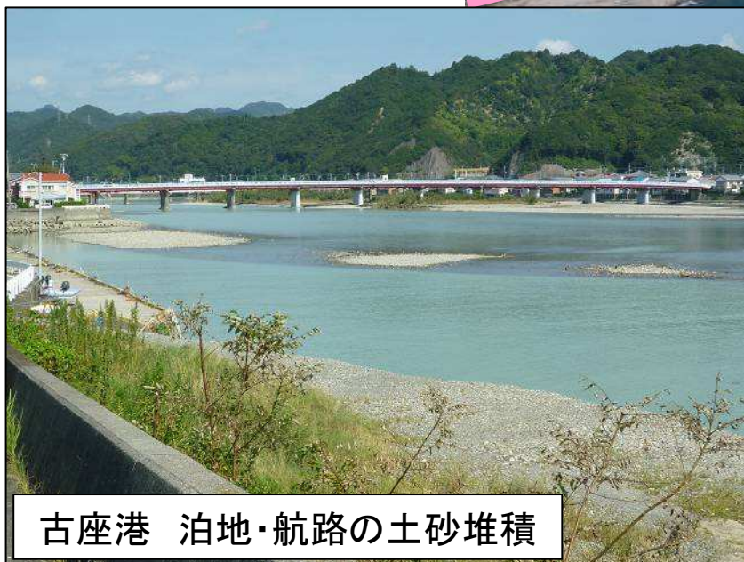
古座港 泊地・航路の土砂堆積