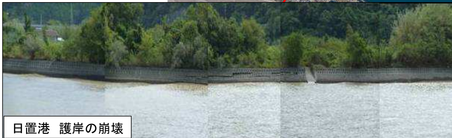
日置港 護岸の崩壊