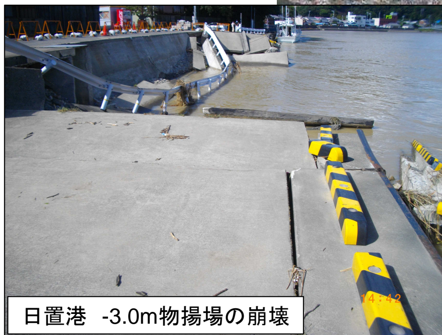
日置港 -3.0m物揚場の崩壊