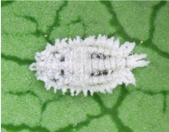
写真1 クロテンコナカイガラムシ雌成虫 (背中に特徴的な黒斑)