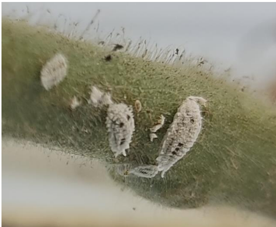
写真2 ミニトマトの株元付近に寄生する 雌成虫と幼虫