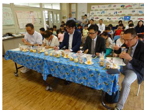
（今年度の試作コンペの様子）