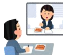
専門家による指導