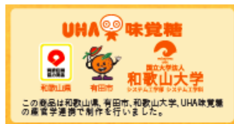
【パッケージ裏面デザイン一部抜粋】