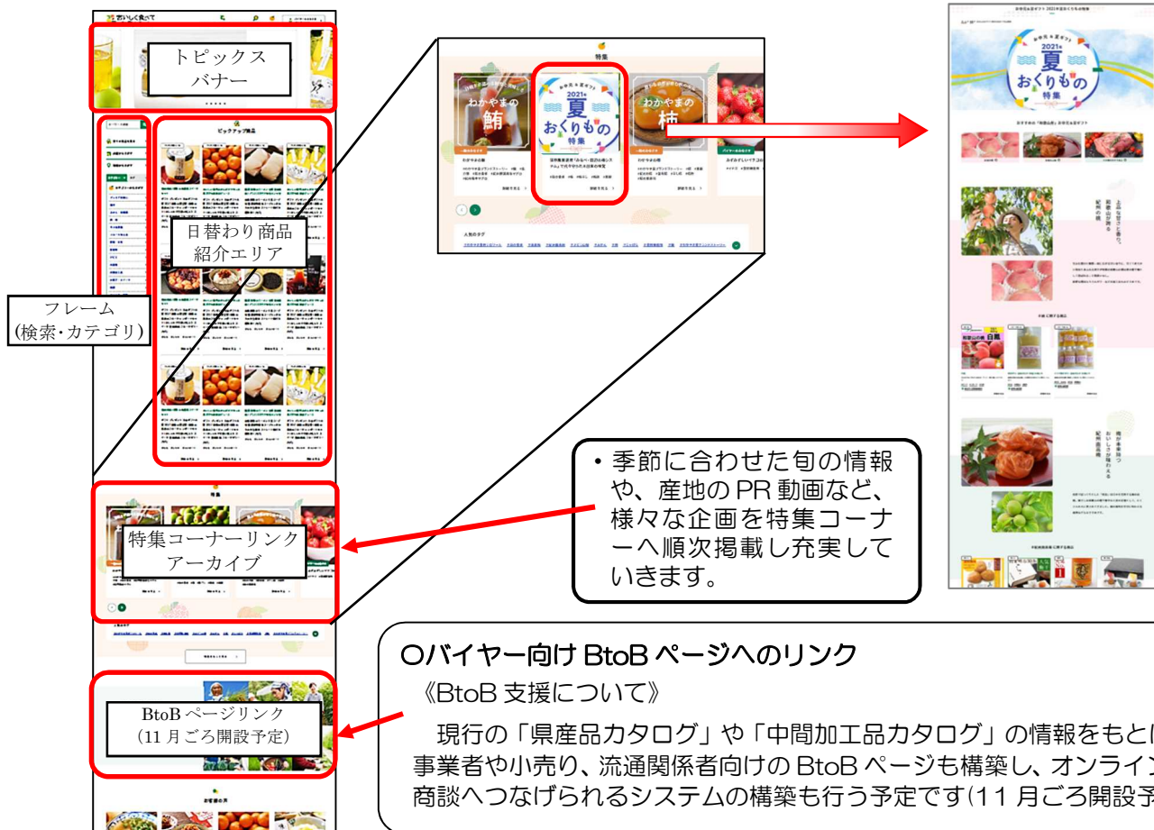
(特集ページのイメージ)