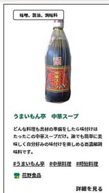
(商品紹介アイコン)

ピックアップコーナー、商品検索結果等、各エリアの商品紹介欄には商品アイコンとして左の商品紹介アイコンを掲示。