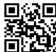
(モール QR コード)