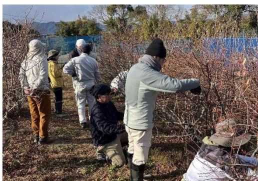
ブルーベリーのせん定