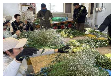
カスミソウ出荷調整