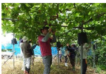
ブドウの果房整形