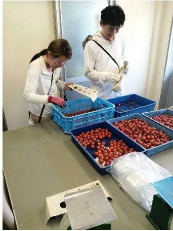
ミニトマトの出荷調整