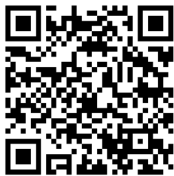
ホームページ QR コード

ホームページ ( https://www.pref.wakayama.lg.jp/prefg/071601/sintyakujouhou/index.html ) やSNS (Instagram: wakayama_shunou) において、就農に関する相談会の開催や研修募集等の情報を提供するとともに、実施した研修の内容等を紹介