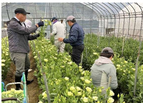
トルコギキョウの採花