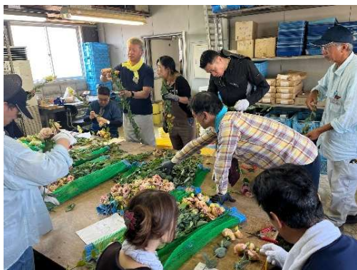
トルコギキョウの採花・出荷調整