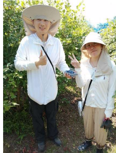
ブルーベリーの収穫