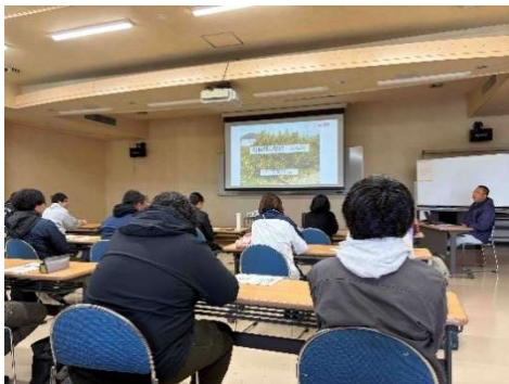
聴講制度 (研修生とともに受講)