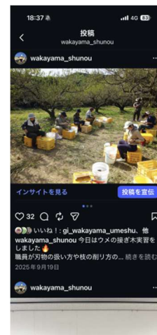
就農支援センターInstagram