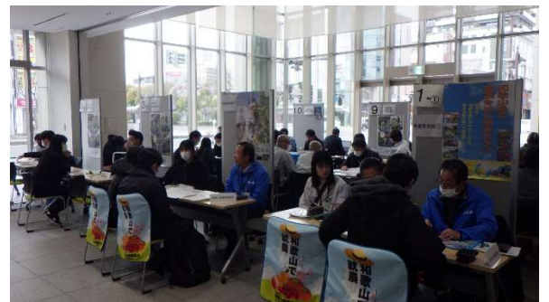
第3回AGRIわかやま就農相談フェア (2/8 和歌山県JAビル)