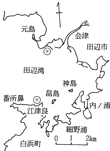
図4 フトミゾエビ放流場所 ⊗放流場所