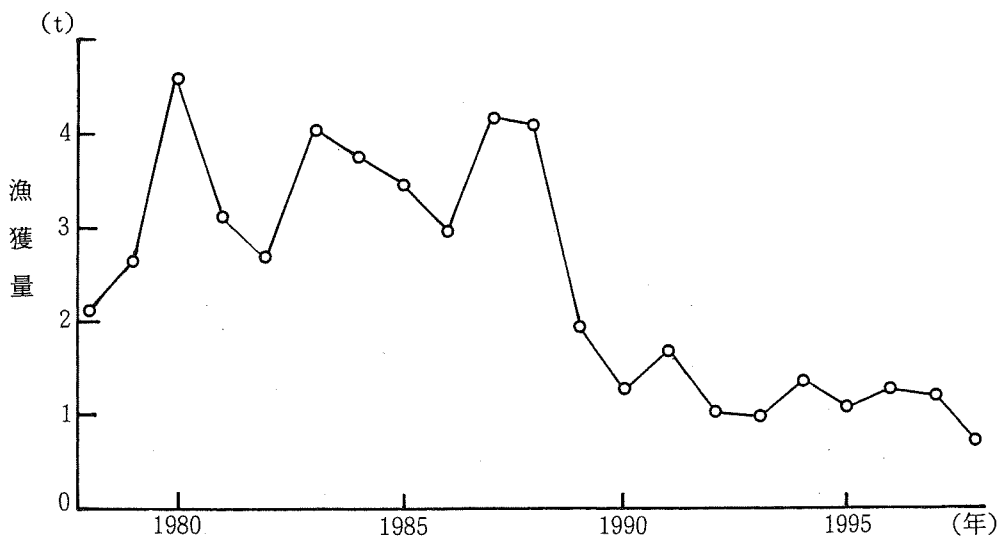
図1 田辺漁協におけるクルマエビ類漁獲量の経年変化 (田辺漁協資料)