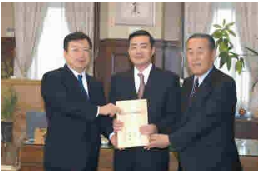
左から、木村知事、竹田代表取締役(セイカ(株))、笹町長