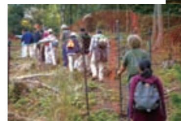
当社植林地:「ながきの森」散策