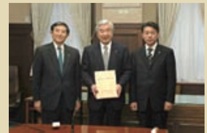
積水化学工業(株)調印式

和歌山県の「企業の森」は、H14の事業開始以来着々と環境先進企業等の皆様に参画いただいておりますが、今年度（H19）新たに7企業、4団体がこの「企業の森」を活用し、県内で森林保全活動を実施していただくこととなり、全国最多の38企業・団体の参画が得られ、和歌山県の森林環境保全がより一層進むものと感謝をしております。 現在も、多数の企業等との交渉も継続中で、今後さらに参画企業等が増えるものと期待をしております。