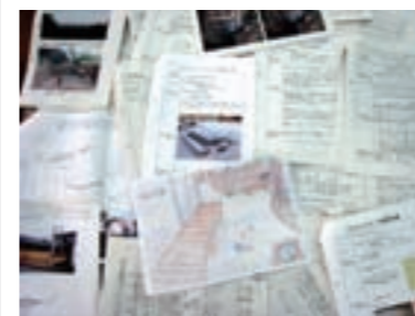
間伐材の活用方法提案を募集「木づかいコンクール」

和歌山県那賀地域の産官学「林材関係者」「国・県・市」「大学」に加えてNPO団体等の地域住民の参画も得た地域横断型組織「千年の森創造会議(会長 紀の川市長)」が平成18年8月に結成されました。コンセプトは「木材を使って減らそう 荒廃人工林 CO 2 花粉症」地域の森林について諸問題を議論し、相互協力を行うとともに、地域住民を対象にさまざまなPR事業を展開しています。