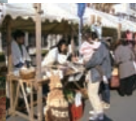
社内イベントに龍神村から出店