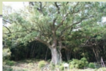
苔玉づくり 巨樹めぐり クスノキの巨木(町天然記念物)