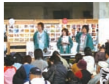
翔龍祭での抽選会

当社は昨年4月より田辺市龍神村で植林を開始しました。お世話になっている龍神村の皆様と交流をしていきたいという思いから、地元イベント・翔龍祭(11月開催)で当社の活動を映像やパネルで紹介したり、健康機器を中心とした商品を選定してプレゼントし、ご好評いただきました。その一週間前には当社が植林をしている「ながきの森」を地元の皆さんと散策、植林後の様子や周囲の自然を味わいました。 また、当社の本社で行われた社員向けふれあいイベントに龍神村からも出店。特産品などを販売いただき、相互で交流を深めました。