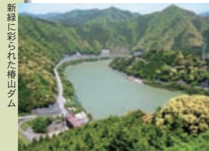
新緑に彩られた椿山ダム