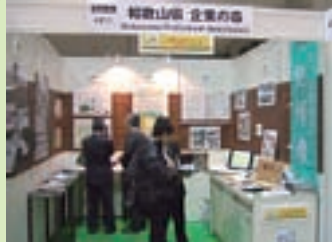
エコプロダクツ2007出展

和歌山県では、この「企業の森」事業を今後も積極的に進めるため、新年度(平成20年度)予算を更に拡充しました。 新年度は、従来からの事業広告や本情報誌「CSR WAKAYAMA」の継続発行、エコプロダクツ2008への出展などに加え、新たな施策として、「企業の森」プロモーション映像の制作を行うこととしました。