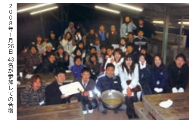
2008年1月26日 43名が参加しての合宿

連合和歌山青年委員会・女性委員会は、1月末に由良町白崎の海と山で「環境問題を考える」学習・交流会を開催しました。 環境問題に関するエコクイズに挑戦しながらゴミを拾う清掃ウォーク、豚汁作り・飯ごう炊飯を通じ、改めて環境保全の重要性・ゴミ問題を認識しました。 参加者の中には、マイ箸を持参された方もあり、すでに環境問題への意識が高い人もいます。 今後も、連合和歌山組合員とその家族個人個人が環境保全・保護に努めていけるような活動を展開していきます。