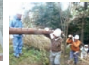
地域住民が間伐体験

高野町 URL http://www.town.koya.wakayama.jp/