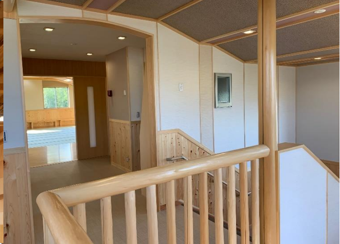
西牟婁郡上富田町 熊野高校講堂