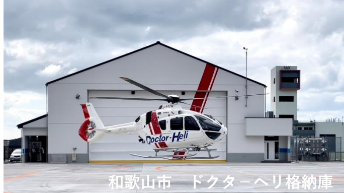
和歌山市 ドクターヘリ格納庫