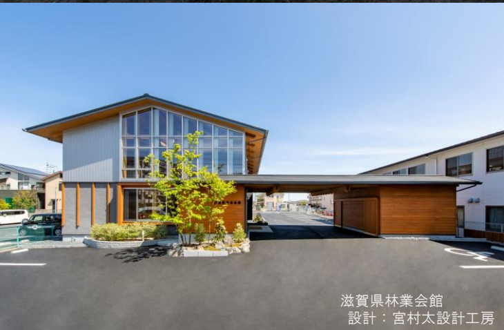
滋賀県林業会館 設計：宮村太設計工房