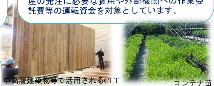
中高層建築物等で活用されるCLT