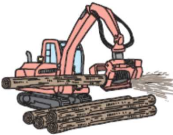
活躍する高性能林業機械

「事業経営改善合理化資金（素材生産等促進資金）」は、施業集約化、立木購入、作業道の開設・改良費用等の素材生産を自ら行ったり、委託するのに必要な資金や素材の購入代金、製材等の購入代金をはじめ、製材等の引取に必要な輸送費を対象としています。