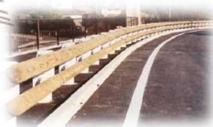
木製ガードレール