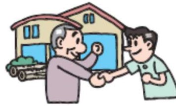
連携した安定供給が重要