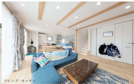
リビング・キッチン