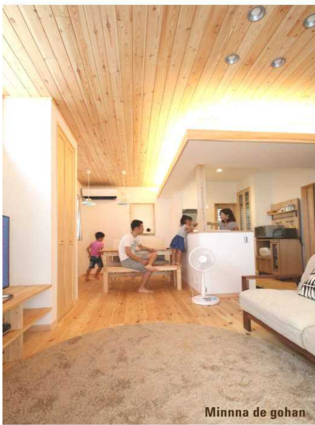
Minna de gohan