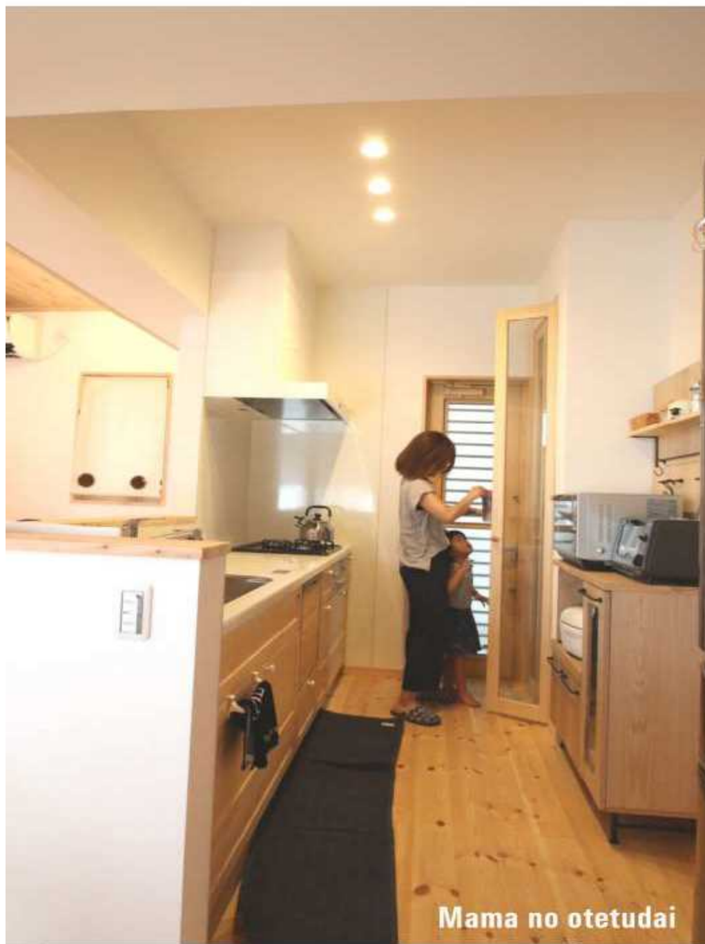
Mama no otetudai

Kyou ha papa ga oyasumi. Minna de gohan wo taberuyo. Watashi ha mama no otetudai. Watashi no oheya no tana ni ehonn wo kazatteruno. Okiniiri wo takusann narabeteruyo. Outiha ki no kaori to nukumori ni ahureteruyo. Mainiti kaerunoga tanoshiminanda!