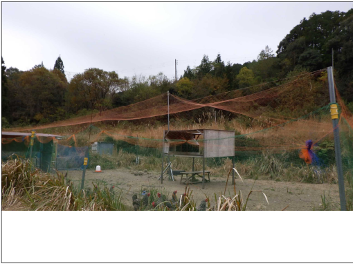
図5 新規採卵鶏農家飼養状況