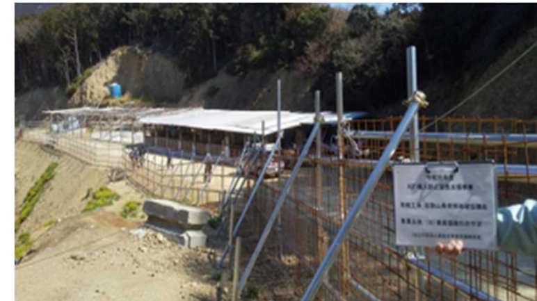
図2 防護柵設置農家