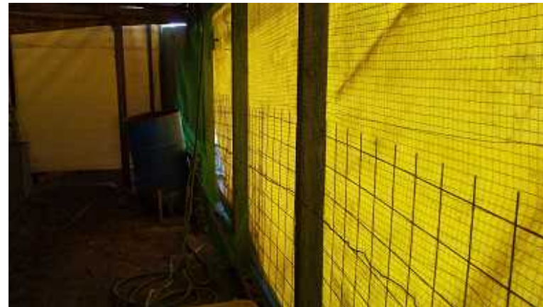
図1 防鳥ネット設置農家