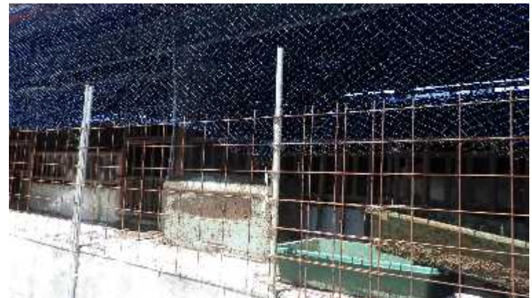
図3 防鳥ネット、防護柵設置農家