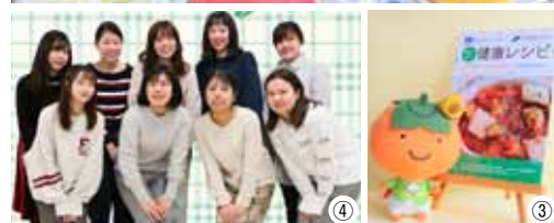
健康レシピ（①及び②）、健康レシピの冊子とかきおうじ（③）、大阪樟蔭女子大学の学生のみなさん（④）、試食提供の様子（⑤及び⑥）