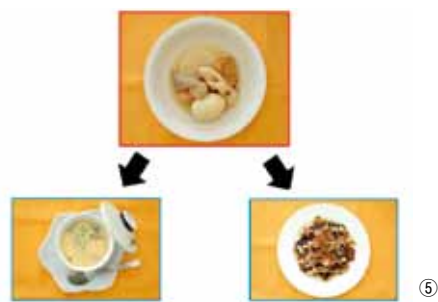
レシピの窓口配布（①）、取材を受けた際の様子（②及び③）、これまで発行したレシピ（④）、料理のアレンジ例（⑤）