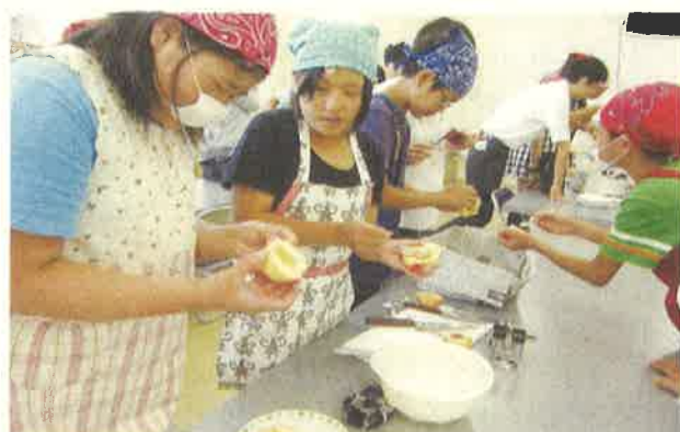
ももを使った授業の様子