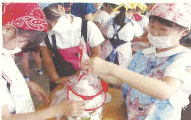
うめジュースづくりの様子

本年度は、みかん、かき、魚に、うめ、ももを加えた5品目を提供することとしています。