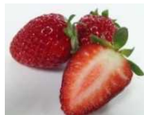
いちごの粗収益比較 (R1年産)

「まりひめ」は県内のいちご作付面積の62%を占め、農家の 所得向上に寄与した 今後もオリジナル品種の育成を継続する必要