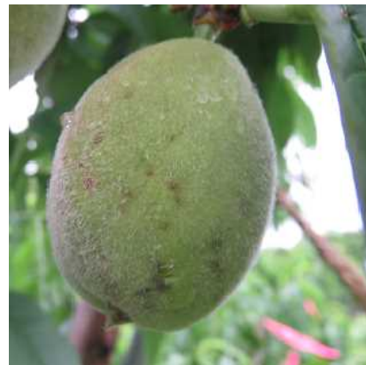
写真2 モモせん孔細菌病の発病果実