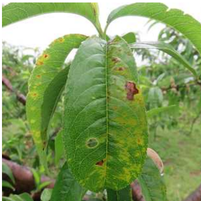
写真1 モモせん孔細菌病の発病葉