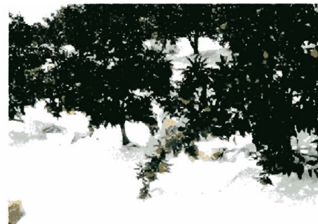
写真. 極早生ミカンのマルチ（7月中旬までに被覆）