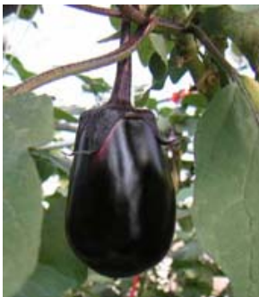
写真1 水ナス系統 No. 1-1-3 の果実