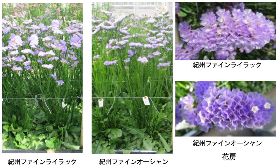
図1 ‘紀州ファインライラック’と‘紀州ファインオーシャン’の栽培時の草姿と花房