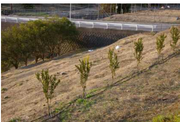
‘はるき’の苗木（平成30年春植栽）

収穫適期、貯蔵性、苗木からの生育、収量性などを明らかにするため、引き続き特性把握のための試験を実施予定。