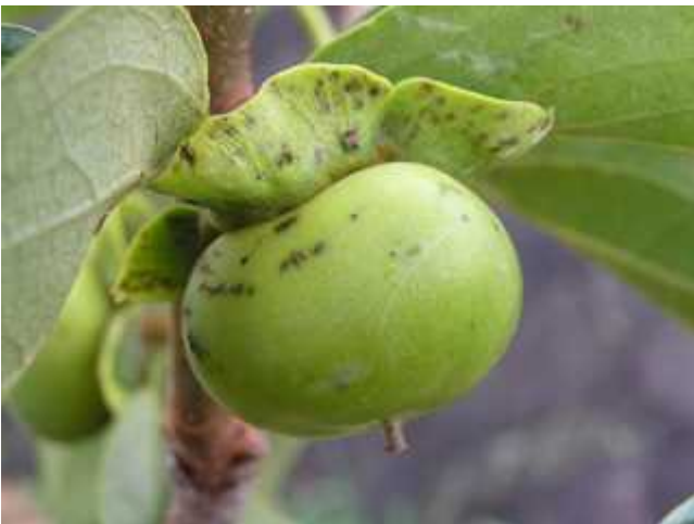
幼果の被害 (黒く隆起する)