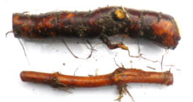
根茎の化粧品原料への活用