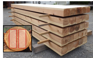
スギ心去り製材品

このため、今後供給増加が見込まれるスギ大径材の需要拡大のため、梁桁材の心去り製材品の生産技術の確立を目的として、県産スギ平角材の強度特性の検証を行います。(岡本)