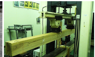
木材の曲げ強度の測定