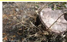
シカ食害による枯死株

ウバメガシ伐採株の萌芽のシカ食害を防ぐため、製炭者等が容易で安価に実施できる防除方法を開発するとともに、被害状況からシカ防除基準を作成する研究に取り組みます。