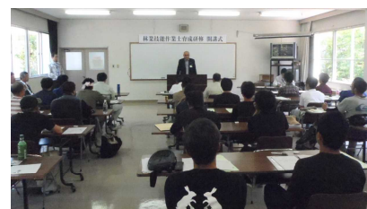
「林業技能作業士育成研修」の開講式

5月20日に林業試験場にて「林業技能作業士育成研修」の開講式が行われました。研修生は31名で12名の方が最終年となり、林業技能作業士として認定される予定です。