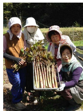
太くて立派なイタドリ

特用林産部では、平成21年度から休耕田等を活用したイタドリ栽培の研究を始めました。