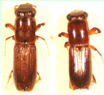
カシナガキクイムシ (左:メス 右:オス)

部長(副場長) 田上 耕司 主査研究員 法眼 利幸 主査研究員 山下 由美子 主査研究員 大谷 栄徳 研究員 竹内 隆介