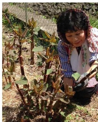
植栽3年目の今春は収穫2回目