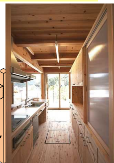
※写真：中村伸吾設計室HPより転載（龍神の家）