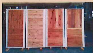
印象評価試験サンプル

「快適な紀州材内装材の提案に向けた印象評価調査」に関するアンケート調査を今年度の紀州材家づくりフェア会場において実施する予定です。