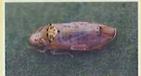
オビヒメヨコバイ族の一種

サカキの新たな害虫（オビヒメヨコバイ族の一種）の防除に向け、高知県と連携し年間の発生消長等の本格的な調査を開始しました。