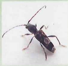
スギノアカネトラカミキリ

スギノアカネトラカミキリ（アリクイ）被害対策に関する研究成果について、競争力アップ研究成果集に掲載されます。