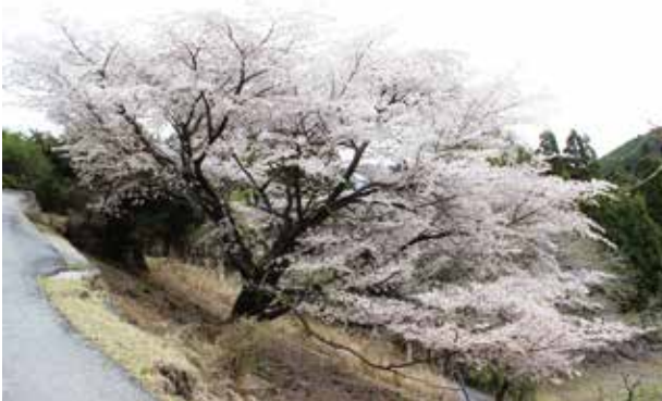
図1 満開になったクマノザクラ(古座川町)

紀伊半島南部で風変わりなヤマザクラとされていた淡紅色の花弁をもつサクラが、新たな野生種「クマノザクラ( Cerasus kumanoensis T.Katsuki)」として2018年春に発表されました。