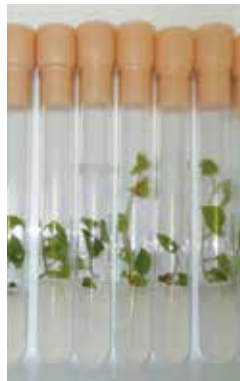
図1 組織培養による増殖

県内9地域から採取したイタダリの挿し木より得られた苗(17系統49株)を試験場内で育成し、各系統の収量や特性を調査しました。その結果、若芽の発生時期が早く、太くて収量が多く、皮が非常に剥きやすい「東牟婁3」を優良系統株として選抜しました。苗は組織培養により増殖を行い、6月に(一財)バイオセンター中津において優良系統苗として販売が開始されました。今年度分については完売しましたが、来年度も販売を行う予定です。