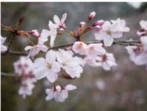
図2 クマノザクラの花

クマノザクラの主な特徴は、①開花が早く、個体によっては2月下旬から咲き始め、3月中旬～下旬に見頃を迎える、②葉が出る前に花が開く(写真2)、③白～淡紅色の花弁をもつ、④ヤマザクラよりも樹高が低く、枝が細いことです。以上から、緑化木や観賞木としての利用が期待されています。