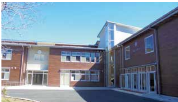
図1 左側正面:玄関ホール 右側:普通教室棟

平成29年2月竣工した「田辺市立新庄小学校」(木造2階建(一部鉄筋コンクリート造)延床面積2,929㎡)です。