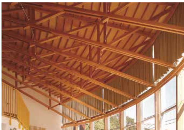
図2 校舎中央部の多目的ホール小屋組

このホールと各棟の間には防火壁(鉄筋コンクリート造)として玄関ホールと中央階段をそれぞれ配置することで、木造であるホールと各棟の延床面積を1,000㎡以下にし、裸木造を可能にしています。