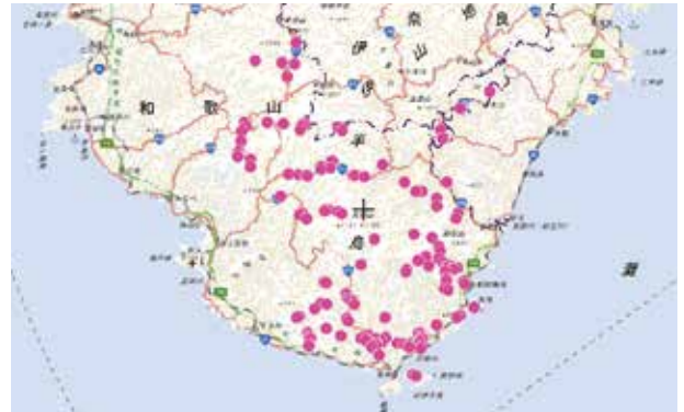
図3 クマノザクラの確認された地点(和歌山県内)

日高郡(みなべ町、日高川町)、田辺市、西牟婁郡(白浜町、すさみ町)、新宮市、東牟婁郡(那智勝浦町、太地町、古座川町、北山村、串本町)