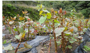
休耕田等を活用したイタダリ栽培試験地

イタダリの野生株の中から栽培に適した優良系統株の選抜を行い、増殖方法の検討を行うとともに休耕田等を活用した栽培技術の確立を図ります。