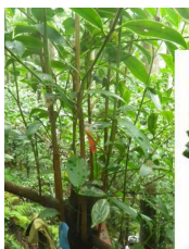
サカキの断幹による更新・再生技術