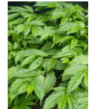
赤ミズ(ウワハミソウ)