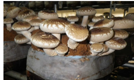
梅酢を添加した菌床シイタケ