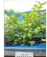
優良系統の選抜試験