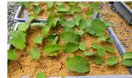
選抜したイタダリの挿し木による増殖