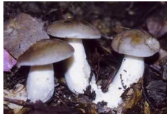
ホンシメジの林地栽培

ホンシメジの林地栽培や和歌山県らしさをPRでき、県産素材（梅酢や紀州備長炭等）を活用した特色のある菌床キノコの栽培技術の開発へ向けた研究を行います。