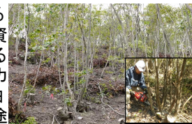
備長炭原木林の「択伐」施業