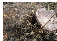
シカ食害による枯死株