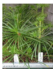
コウヤマキの挿し木技術