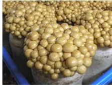
炭を添加した菌床ナメコ