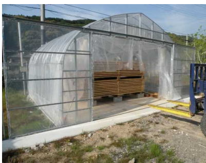
太陽熱利用木材乾燥施設 (本体と産業用除湿機)