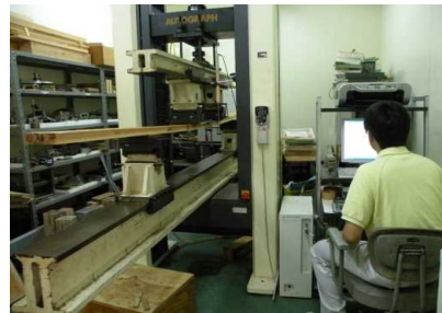
木材の曲げ強度の測定

このような現場ニーズに即し、地域の木材産業の支援につなげるための試験研究に取り組んでいます。