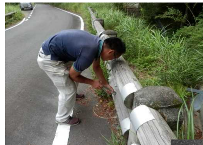
木材の耐久性診断 (ピロディン)