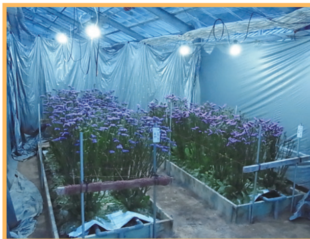
スターチス電照試験（関連記事2面）