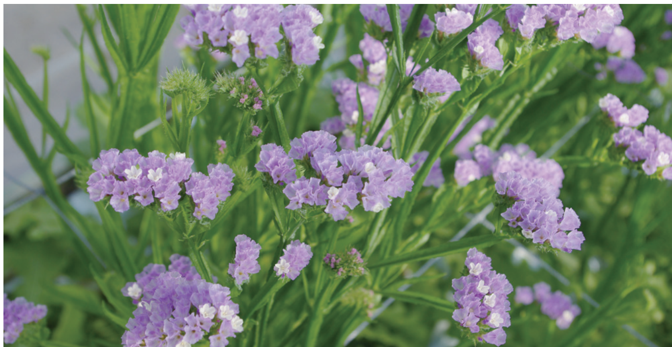
紀州ファインラベンダー（暖地園芸センター育成品種 平成25年7月品種登録出願公表）