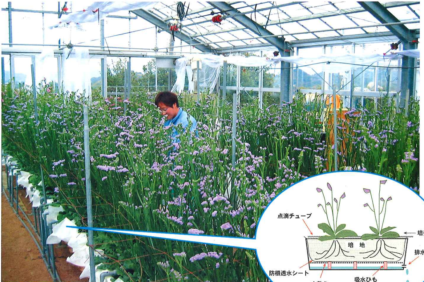
スターチスのコンテナ式簡易養液栽培(関連記事 4 ページ)